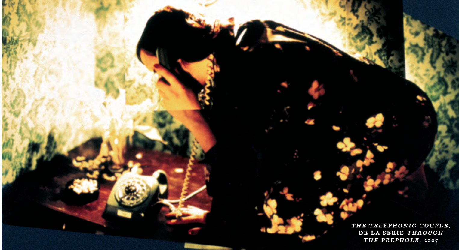
THE TELEPHONIC COUPLE, DE LA SERIE THROUGH THE PEEPHOLE, 2007